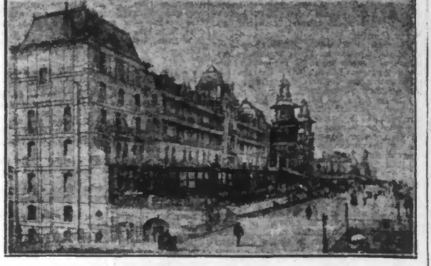
BLANKENBERGHE. - La Digue de Mer et le Casino.