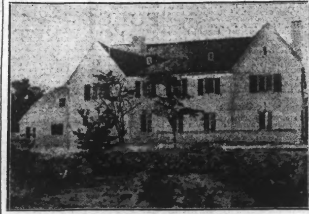
La maison familiale des Lindbergh à Hopedewell (New-Jersey) d'où l'enfant fut enlevé et près de laquelle son cadavre vient d'être retrouvé.

Le petit Charles-Auguste Lindbergh et sa mère. Le cadavre du bébé Lindbergh a été découvert dans un champ près de la demeure de ses parents.