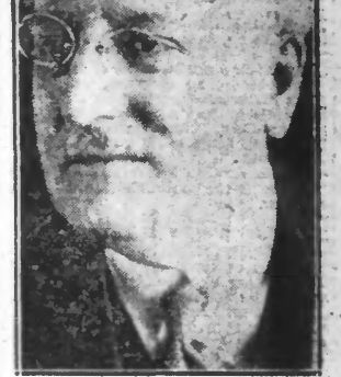
M. Albert Lebrun, ancien Préfet de Meurthe-et-Moselle, qui vient d'être nommé Secrétaire général de la Présidence de la République.