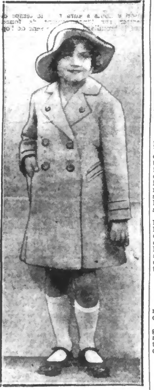
Manteau de fillette en ratine beige avec bandes piquées.

LES ISOLÉES qui désirent les patrons primes des modèles ci-dessus n'auront qu'à nous adresser leur commande accompagnée du montant en timbres-poste.