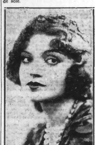
Toque paille tricotée, broderie de soie.

Le tricot est arrivé à une telle perfection que les sweaters sont maintenant tout aussi habillés que les blouses de soie.