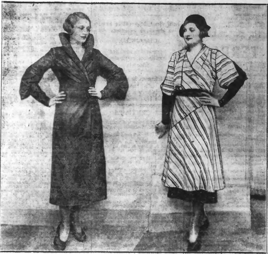
Manteau de taffetas marron travaillé de bandes piquées. Sur un fond noir, dent : clair à rayures.