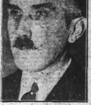
M. VON PAPEN qui a été chargé de former le nouveau Cabinet allemand.

Arrivé à la porte donnant accès aux couloirs intérieurs, le doyen d'âge s'inclina, selon la tradition, devant les deux officiers qui le saluèrent du sabre, tandis que prenait fin la sacro-sainte manifestation de sympathie que les journalistes et quelques députés présents dans la salle lui avaient faite à son passage.