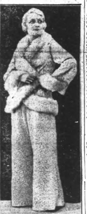
UN BIEN JOLI PYJAMA

En adoptant, il y a quelques années, la commode petite jupe courte, on semblait avoir résolu ce difficile problème: ne pas recourir au pantalon excentrique tout en conservant l'aisance des mouve-