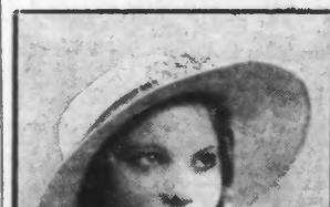
Grand canotier cizol naturel garni gros grain.

Il y a trois longueurs de jupes qui répondent à des heures et à des circonstances bien définies.