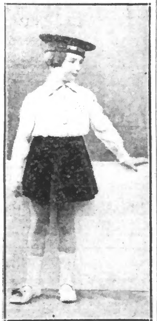
Costume marin fillette, jupe plissée et blouse toile de soie.

Toute bonne ménagère Rubigine TIREL se doit d'avoir la seule produit élevant les taches de rouille sans brûler le linge.