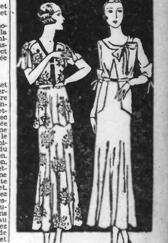
N° 3.117 N° 3.118 Métrage : 6 mètres Métrage : 5 m. 75 m. 1 mètre.

A gauche. — Gracieuse et facile à porter, cette robe sera exécutée en crêpe fleuri ou soierie fantaisie.