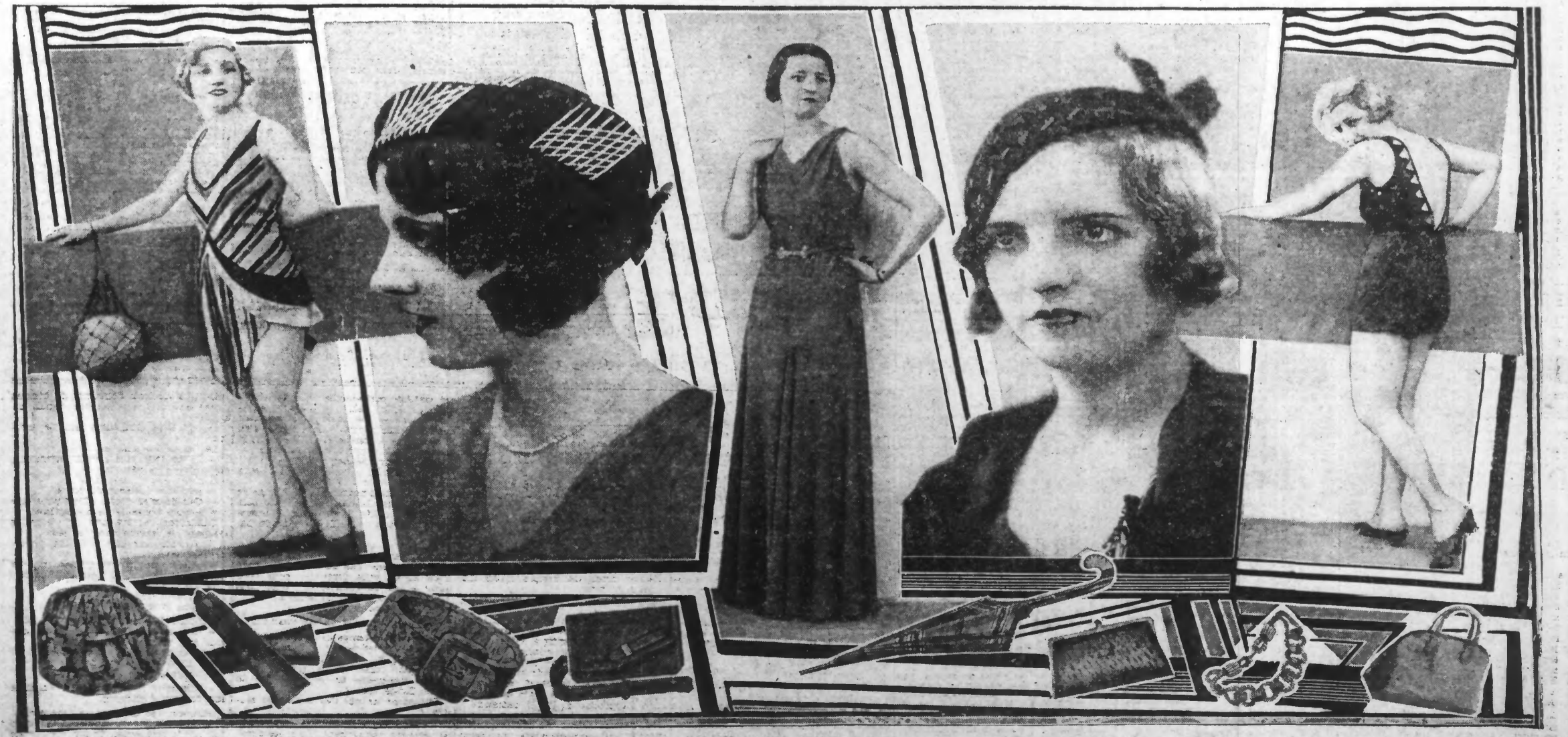
De gauche à droite. — Maillot de bain en jersey rayé-bleu marine et jonquille. — Toque feutre noir-broderies blanches. — Robe du soir crêpe satin vert avec découpes. — Toque feutre rebrodé nœud assorti. — Maillot jersey coq de roche découpé. En dessous. — Les colifichets à la mode : sacs, gants, ceintures, etc...

Les lectrices qui désirent les patrons-primes des modèles ci-dessus n'auront qu'à nous adresser leur commande accompagnée du montant en timbres-poste. Le prix de chaque patron est de deux francs. Les envois sont faits franco à domicile. Bien indiquer le numéro du ou des patrons demandés et l'adresse du destinataire. Envoyez votre demande à : « Service des Patrons du « Réveil du Nord », 186, rue de Paris, Lille.