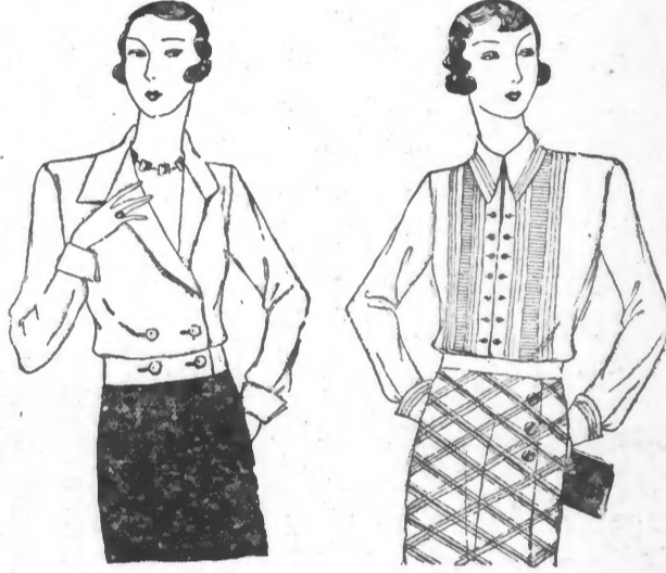
No 1872 Métrage : 2 m. en 1 mètre No 1874 Métrage : 1 m. 90 en 1 mètre

A GAUCHE. — Blouse-gilet en crêpe de Chine ou toile de soie croisée par deux boutons elle se resserre dans une ceinture plate. Col à revers. A DROITE. — Chemisier en toile de soie. Le devant s'orne de petits plis et se rehausse d'un col rabattu.