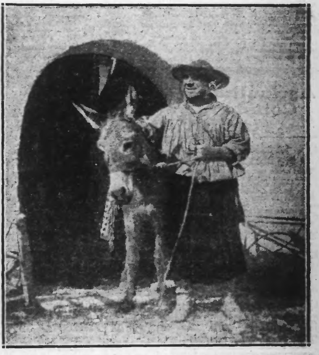
Plusieurs versions pariantes de ce film qui a pour protagoniste le célèbre artiste russe CHALIAPINE, ont été tournées. Voici George ROBAN, qui incarne SANCHEZ PANÇA dans la version anglaise.

UN ACCORD INTÉRESSANT On sait que la Société des Films « Osso » distribue la prochaine grande production de la « Cines-Pittaluga » : « Les Amours de Persepolis ». Par cet accord, la Société des Films « Osso » a obtenu la distribution en Italie de trois grandes films de sa production : « Un fils d'Amérique », « Hôtel des Etudiants », « Un peu d'amour ».