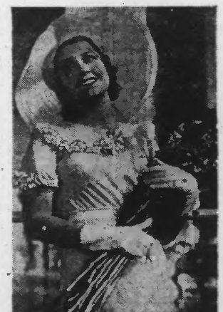
Voici Jeanette MAC DONALD dans ce film où elle a pour partenaire Maurice CHEVALIER.