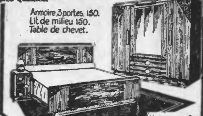
Armoire 3 portes, 150. Lit de milieu 150. Table de chevet.

Nous rappelons nos "LÉVITANLUXE" à 3.000 fr.