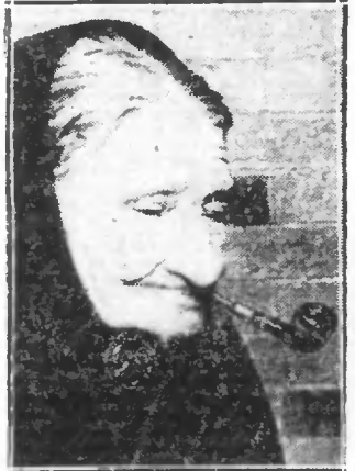
Vieille Bretonne fumant sa pipe