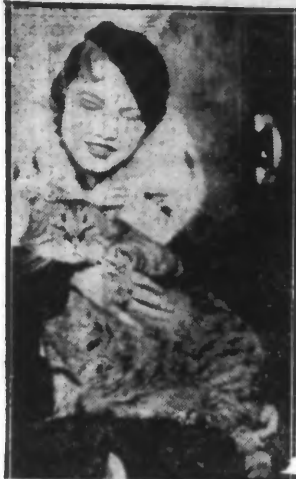
Voici « TOTOCHÉ », champion des poids lourds dans le monde des chats ; il pèse le poids extraordinaire de 11 kilos 500