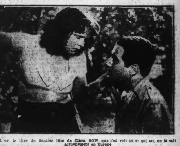
Tel est le titre du dernier film de Clara BOV, que l'on voit tel et tel est, au 16 bis, actuellement en Europe