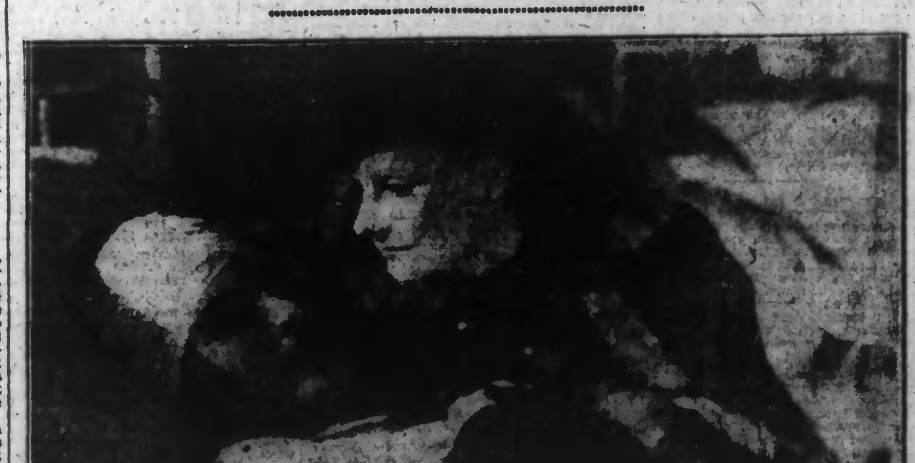
On voit ici une scène de cette production avec Greta GARBO et Ramon NOVARRO