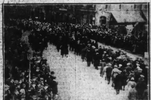
Le cortège débouchant place de l'Hotel de Ville d'Armentières entre une double haie de curieux massés sur les terre-pleins

Un immense cortège a défilé, hier après-midi à travers les rues de la Cité de la Toile.