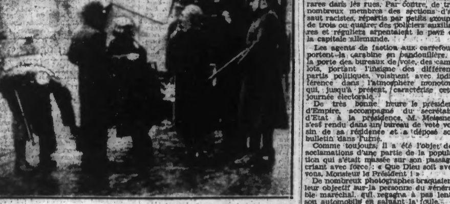
Schupos fouillant des communistes pour s'assurer qu'il ne sont pas porteurs d'armes

Le parti communiste subit des pertes lourdes, par contre, le parti de centre se maintient et même légèrement la Social-Démocratie paraît se maintenir. Les petits partis sont écimés.