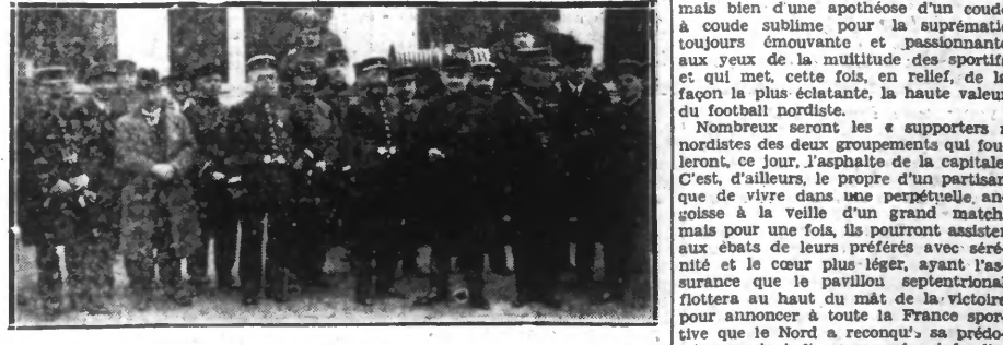
La réception en gare de LENS des délégations d'officiers de sapeurs-pompiers de Paris et de sapeurs-pompiers Belges.

Elles ont débuté hier par la réception des délégations venues de Paris et de la Belgique