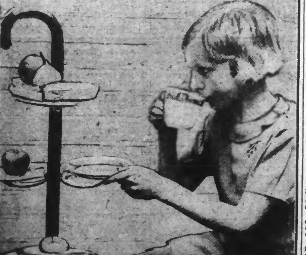
A l'Exposition Impériale de Kensington (Angleterre), Lord Conway inaugure la première exposition réservée exclusivement au camping.