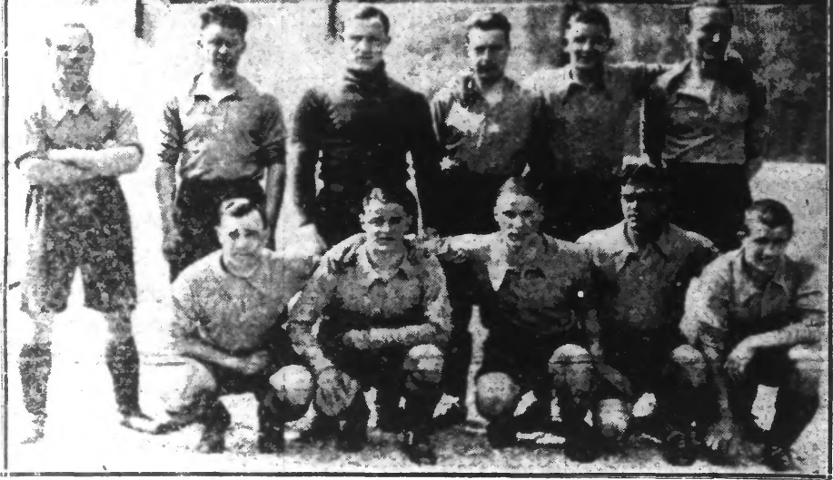
Les deux équipes roubaissiennes qui matcheront cet après-midi, à COLOMBES, pour s'attribuer la COUPE DE FRANCE

LES JOURNÉES D'INSTRUCTION DES SAPEURS-POMPIERS A LENS Elles ont débuté hier par la réception des délégations venues de Paris et de la Belgique