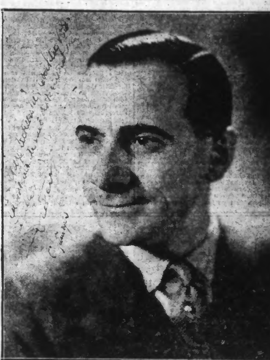
...de passage à Lille, a bien voulu dédier sa photo pour nos Lecteurs