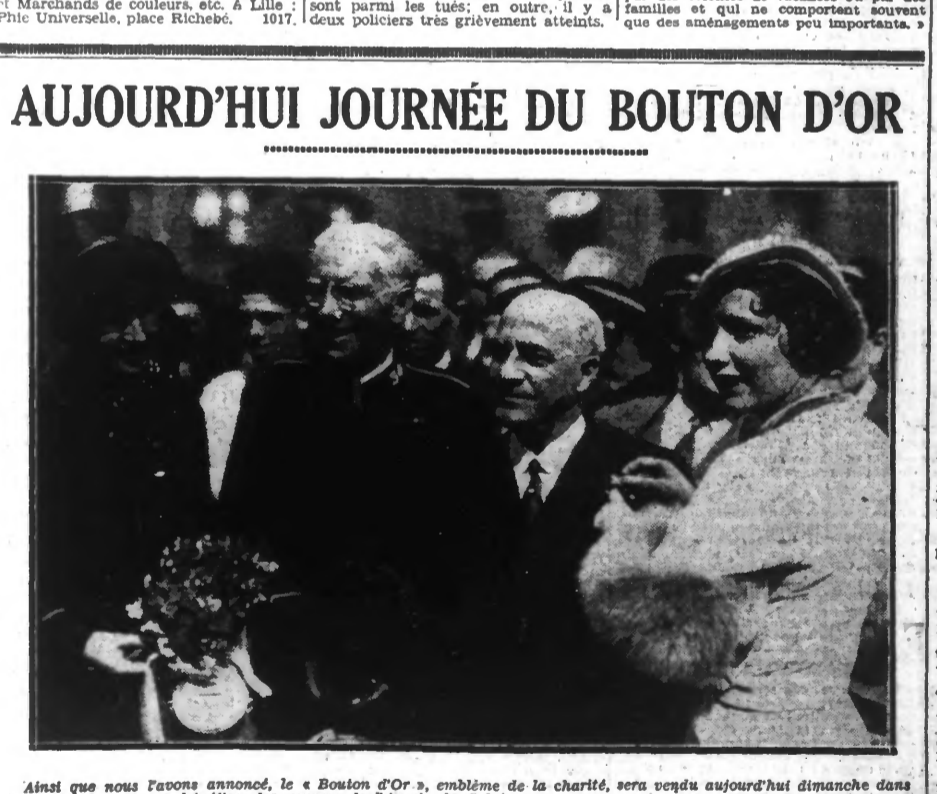
Ainsi que nous l'avons annoncé, le « Bouton d'Or », emblème de la charité, sera vendu aujourd'hui dimanche dans toute la France, au bénéfice des œuvres de l'Armée du Salut.