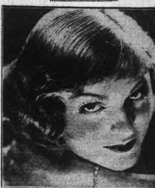
Ce film tiré du roman de Zola, va être tourné à Hollywood. Voici Anna STEN, chargée du rôle de « Nana ».