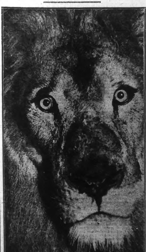
C'est un des principaux interprètes... à quatre pattes, du film « Kappa »