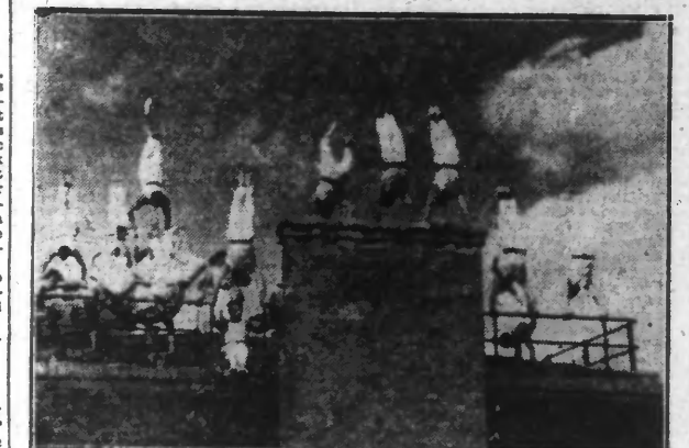
Les Pompiers de Paris n'ont pas le vertige.

Continuant la remarquable série des reportages cinématographiques, PATHE-NATAN vient de présenter un film de J. C. BERNARD, sur les Pompiers de Paris. Il est superflu de vanter le haut sentiment du devoir qui anime ce corps d'élite, orgueil des Parisiens. réaliser les prouesses dont tous sont capables. Pour s'en rendre compte, il faut aller chez eux : c'est pourquoi, avec J. C. BERNARD nous pénétrons dans la Caserne de la Porte Champerret, un modèle du genre au point de vue modernisme.