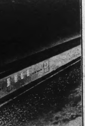
Derniers perfectionnements de l'éclairage pour les trains rapides

Un autorail qui atteint la vitesse de 180 kilomètres à l'heure et qui vient de faire des essais sur la ligne Paris-Le Havre, sera mis en service sur cette ligne à partir du 1 er janvier.