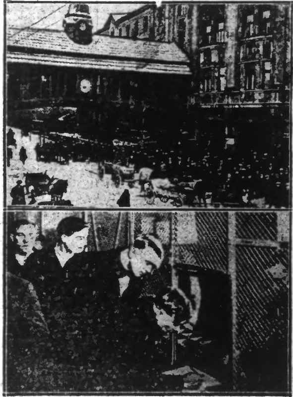
EN HAUT : L'affluence des émigrants et des charrettes chargées de bagages devant le centre de recrutement de M me SLOWICE (Pologne). - EN BAS : La signature des contrats de travail dans la même ville.

principalement ceux de Westphalie, qui venaient d'opter pour la nationalité polonaise, vinrent s'établir en France, et plus particulièrement dans la région du Nord, proche de leur pays d'origine, où il manquait de main-d'œuvre pour les gros travaux, le lendemain de la guerre et pour la reconstitution. A cet effet, une mission française fut envoyée sur place, chargée de recruter