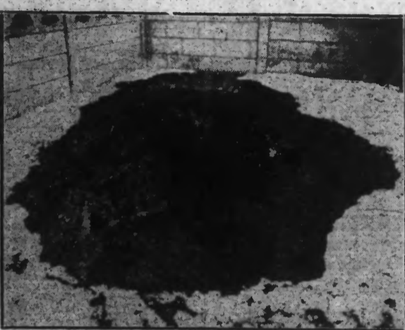
Un trottoir, crevasse, par l'effondrement d'un puits à 10 mètres de profondeur.

Il y a exactement huit jours, nous avons relaté qu'une importante crevasse provoquée par les affaissements miniers s'était ouverte sur le trottoir de la rue