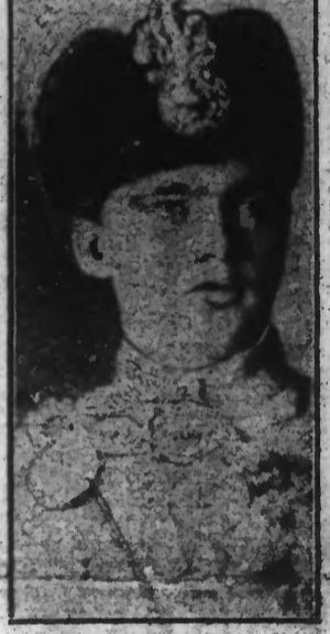
Le jeune Prince Otto de Habsbourg prétendant au trône d'Autriche.

D'autre part, suivant le correspondant d'un journal parisien à Rome, les gens les mieux informés assurent que le chef du gouvernement italien aurait complètement changé son attitude, récemment