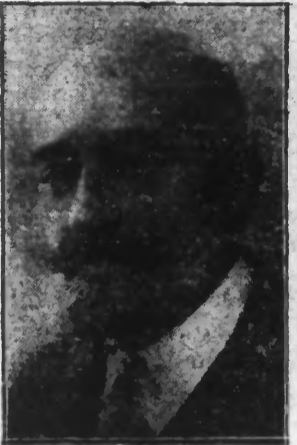
M. D'ALIMIER Ancien Ministre du Travail, qui va être entendu par le juge d'instruction.

Sept ou huit commissions rogatoires ont été lancées hier et M. DALIMIER a adressé une lettre d'explications au Garde des Sceaux.