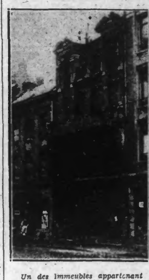
Un des immeubles appartenant aux hospices

Roubaix, cette immense ruche industrielle, est peuplée de milliers de familles de travailleurs qui ont fait la renommée du département du Nord. En y réfléchissant, on se rend compte que les Hospices ont d'autre eux, après avoir passé en majeure partie de leur vie dans les usines ou ateliers pour leur permettre d'élever dignement leurs chers enfants, malgré ce bel exemple de courage, viennent finir leurs jours dans les Hospices de Roubaix. Il est vrai que de leur temps il n'était nullement question de secours, cela que ceux qui sont actuellement alloués aux familles nécessiteuses; sous forme d'indemnités de charges de famille, de vie chère, de familles nombreuses, etc.