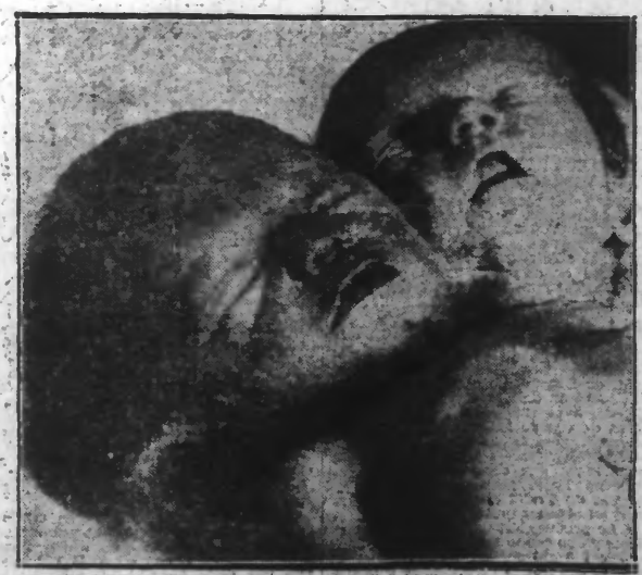
CE PHÉNOMÈNE VIENT DE NAÎTRE A NAPLES.

Lire en deuxième page : Les incendies de Fiches-Thumesnil d'Hellemmes et de Tournai.