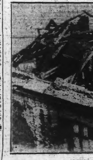
DEUX ASPECTS DU MAGASIN DETRUIT PAR LE FEU.

Nous avons relaté hier comment l'ancien caserne Verhuel, construite en 1756 et affectée depuis plusieurs années au dépôt du matériel de couchage des casernes de Dunkerque, fut la proie des flammes au cours de la soirée de lundi.