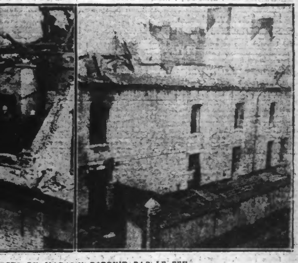
DEUX ASPECTS DU MAGASIN DETRUIT PAR LE FEU.

Nous avons relaté hier comment l'ancien caserne Verhuel, construite en 1756 et affectée depuis plusieurs années au dépôt du matériel de couchage des casernes de Dunkerque, fut la proie des flammes au cours de la soirée de lundi.