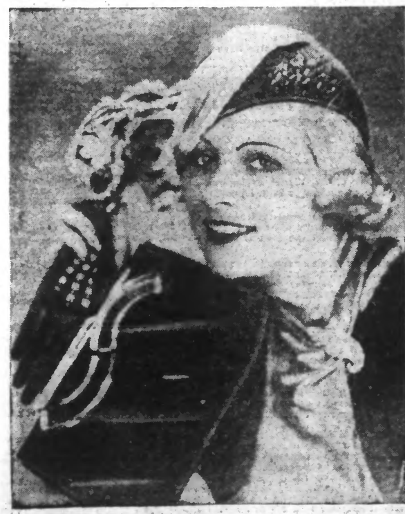
Petite forme paille brillante avec ruban de paille grège.

Envoyer votre demande à « Service des Patronnes du «Événement du Nord», 184, rue de Paris, Lille ».