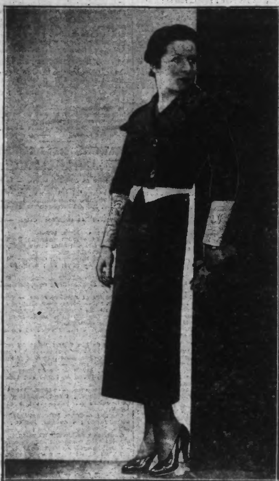
Lainage rouge, jaquette boléro, manches courtes, blouses en suède imprimé.

Prenez une livre de beaux pruneaux. Après les avoir fait tremper trois ou quatre heures, donnez-leur assez de temps de cuisson pour les dénaturer ; les noyaux étant enlevés de façon à laisser le pruneau entier, battez les blancs de quatre œufs en neige très ferme, incorporez dans cette neige les jaunes battus en omelette, puis les pruneaux ; versez dans un moule beurré et mettez à four moyen.