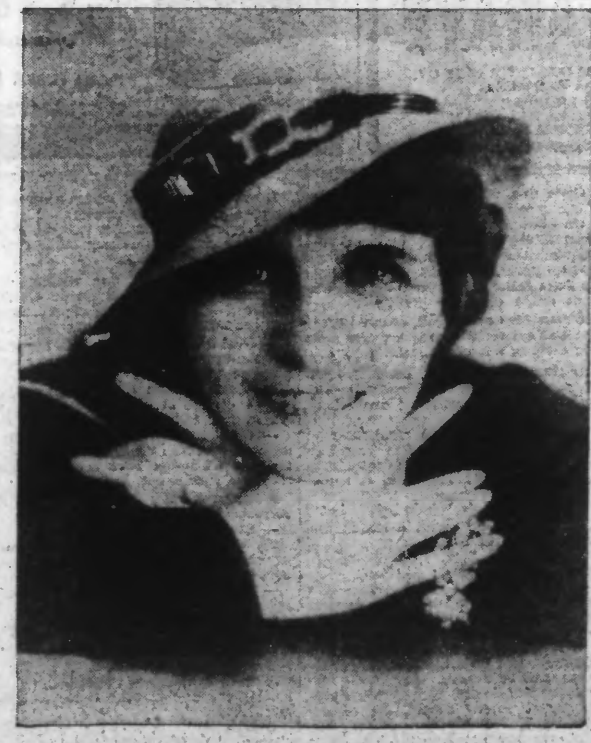
Paille de laine bleue natier, ceinture pour noire boucles métal.