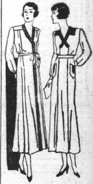
N° 2213 Métrage : 3 m. 55 en 1 m. et 0 m. 45 en 1 m. N° 2214 Métrage : 3 m. 25 en 1 m. et 0 m. 45 en 1 m.

A gauche. — En Vichy de soie uni e. garni d'un galon fantaisie, ce tablier-biouse sera très bien. Le devant monte à un empiècement formant patte d'oie. Le présenté deux par de chaque côté. Il se resserre à la taille par une ceinture nouée.