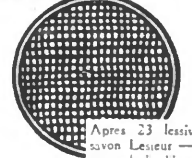
Après 23 lessives au savon Lesieur — savon sans alcali libre, sans soufre — le tissu a conservé intactes toutes ses fibres.

SAVON LESIEUR Economie de savon... Economie de linge