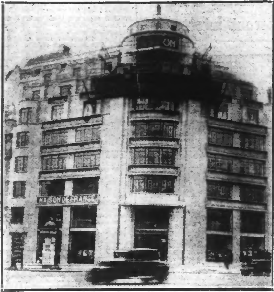
« La Maison de France », Avenue des Champs-Élysées, à PARIS qui est menacée de disparition.