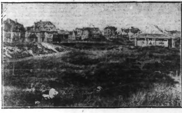
COXYDE. — Vue panoramique.

Le charme des plages belges, leur sécurité, leur confort, leurs prix accessibles aux bourses les moins favorisées sont les causes de leur immense succès. Entre toutes ces grandes ou petites plages existe une rivalité de bon aloi, chacune veut faire mieux que la voisine et de cette émulation productrice de beauté et de confort les baigneurs retirent le plus agréable profit.