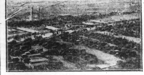
Vue générale. — Le garage des autos au jour de Concours Hippique.

La ville est admirablement tenue, toutes les rues sont goudronnées. On y a réuni tous les services d'hygiène : clinique, goutte de lait, ambulance automobile, réseau d'égoûts, usine d'épuration, etc. Pour les sports, la forêt est accessible à tous, pions et cavaliers, qui, en été, courent avec l'équipage Touquet Dog Hounds.