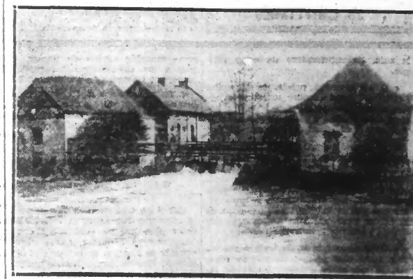
MONTREUIL-SUR-MER. — Le moulin à eau dénommé le Moulin du Roi.

Montreuil-sur-Mer est, on le sait, une très pittoresque cité, un pays de riantes verdure et de vieilles murailles, un admirable belvédère qui commande d'immenses horizons que baigne la lumière du pays marin. Montreuil est aussi le pays des peintres. Nombreux sont toujours les artistes qui traversent la Manche et l'Atlantique pour admirer et interpréter la charmante diversité de ses aspects. Dans ce « Barbazon anglo-normand », au pied des vieux remparts que borde, au Nord, la Canche, on s'arrête, surpris devant la fraîcheur du paysage rustique qu'offre le « Moulin du Roi », restes vivants d'une fort ancienne résidence seigneuriale, dont les palettes dentelées des roues tournent, sans discontinuer sous l'impulsion des eaux agitées de la Canche.