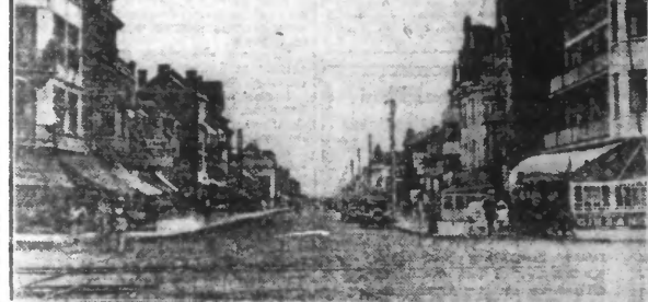
COXYDE. — Avenue de la Mer.

Les nombreux tramways qui relient Coxyde à La Panne, à Neuport et à Ostende, permettent de faire les plus charmantes excursions tout le long de cette admirable côte belge dont chaque station balnéaire est un bijou de propreté, de confort et d'originalité.