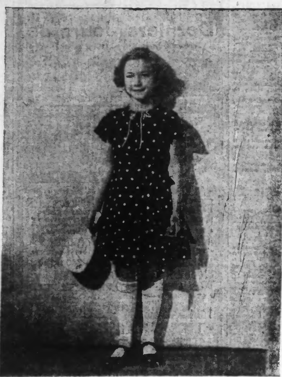
Robe d'enfant en voile marine à pois blancs.

Les nouveaux gants sont en peau mûlle de tissu à manchettes de piqué ou de marocain. On voit le gant à pois assorti à la cravate et le gant écossais s'harmonisant avec le chapeau.