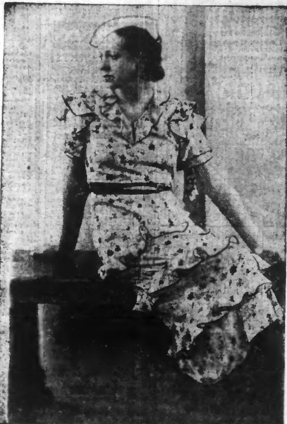
Robe d'été fleurie, jupe à petits volants bordés, ceinture unie.