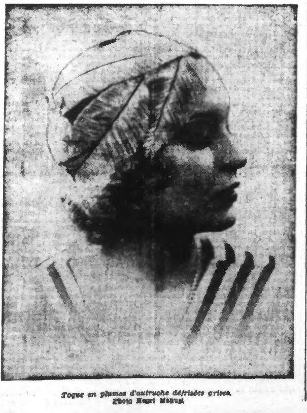
Robe en plumes d'autruche défrisées grises.