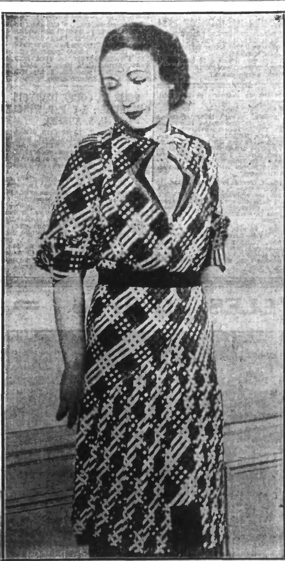
Robe tissu écossais noir et blanc.