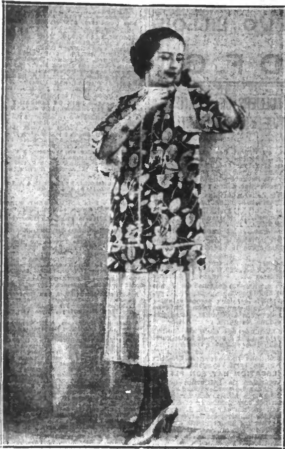
Manteau crêpe de Chine imprimé noir et blanc sur jupe de serge blanche.

Il faut avoir un teint de fleur. Une peau unie, douce et veloutée, sans aucune déféction, cela s'acquiert par des soins Lady M... L... répétés pour son teint splendide, explique-t-elle. Le matin, après mes ablutions, j'étends légèrement le bout des doigts, sur mon visage encore humide, un peu de Crème Teindelys, dans un mouvement de massage circulaire. Cette Crème, préparée d'après les conseils du docteur Raymond, ancien médecin-chef de l'Hôtel-Dieu de Chambéry, a des qualités spéciales qui nourrissent, consolident, tonifient l'épiderme. Sous son action, un afflux de sang frais vient rétablir l'élasticité de ma peau ; il ne me reste plus qu'à pondérer tout le jour, la Crème Teindelys fait son travail et je suis sûre qu'ainsi soignée et protégée, mon teint restera toujours jolii. Prix 6 fr., toutes parumeries. Envoi d'un échantillon contre 1 fr. en timbres-poste. Arys, 3, r. de la Paix, Paris. Conseils de beauté grat. sur demande.