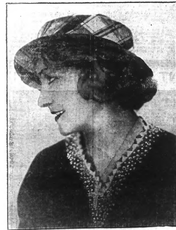
Casotier laffetas écossais vert et beige.

Les lectrices qui désirent les patrons-primes des modèles ci-dessus n'auront qu'à nous adresser leur commande accompagnée du montant en timbre-poste. Le prix de chaque patron est de deux francs. Les envois sont faits franco à domicile. Bien indiquer le numéro du ou des patrons demandés et l'adresse du destinataire. Envoyer votre demande à : Service des Patrons de « Réveil du Nord », 184, rue de Paris, Lille 6.