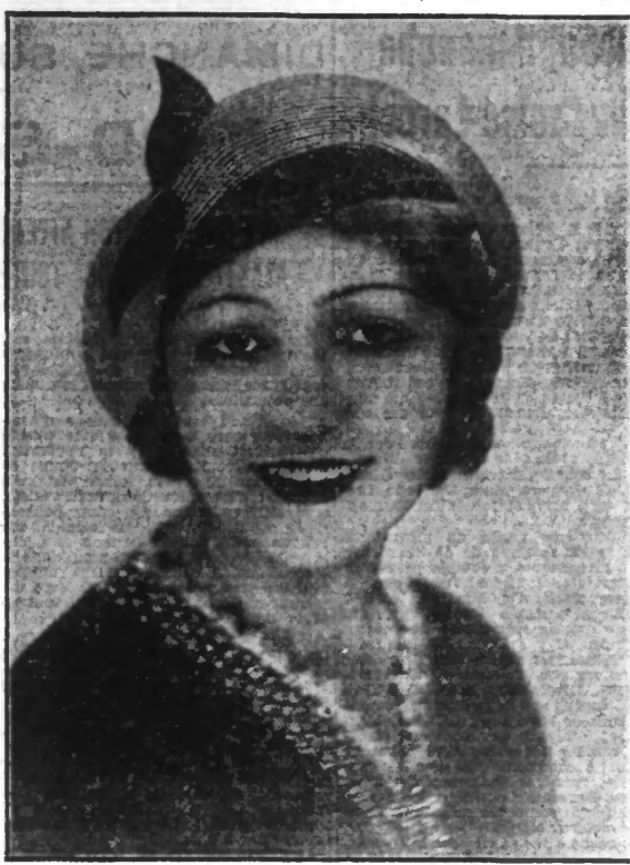
Relevé paille grise et cerise, passe en dam.

CONTRE LES MOUCHES Une plante de ricin dans une chambre ou même dans la cuisine, fait disparaître les mouches comme par enchantement. Ces bestioles détestent l'odeur de l'huile essentielle de la plante.