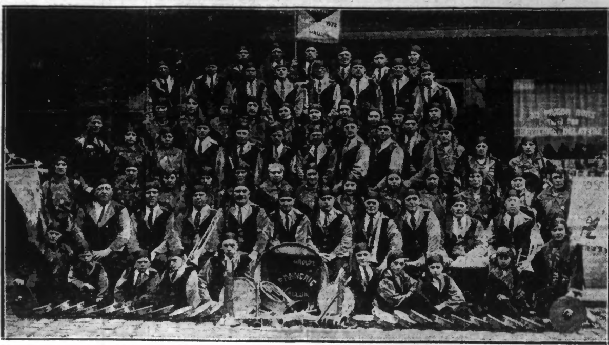
LE GROUPE DES « BOHEMIENS ET BOHEMIENNES ».