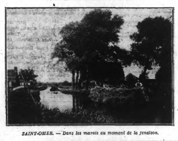
SAINT-OMER. — Dans les marais au moment de la fenaison.