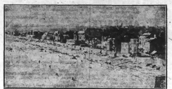
SAINT-CAST. — La plage.

Parmi les beaux sites de la Bretagne, province si variée où les villages offrent tant d'attrait, SAINT-CAST, incontestablement, justifie le renom et l'attrait de revenir au point de départ en effet, ici, offre cette qualité remarquable d'une campagne verdoyante semée de frais vallons aux approches mêmes de la mer dont parfois on se trouve séparé seulement soit par un buisson d'ajoncs fleuris, soit par la pente herbeuse d'une colline.