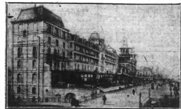
BLANKENBERGHE. — La digue de mer.

Incontestablement, Blankenberghe, est la plage des familles et, après Ostende, la plus importante cité balnéaire du littoral belge. Plus d'un million de visiteurs par an et plus de 350.000 bains par saison attestent la vogue sans cesse grandissante de Blankenberghe.