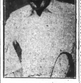
L'Australien J.H. CRAWFORD considéré comme le premier joueur mondial de ce simple.