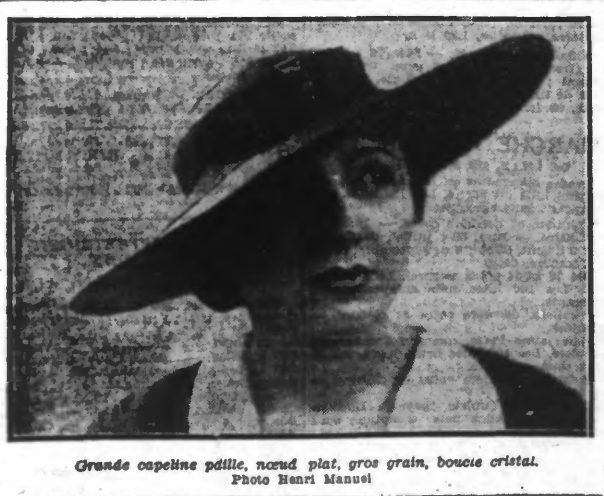
Grandes capelines paille, noué plat, gros grain, boucle cristal.

L'AGE D'UNE FEMME ! Rien n'est plus trompeur. A 30 ans, certaines sont fanées, tandis que d'autres, à 40 ou 45, paraissent encore très jeunes.