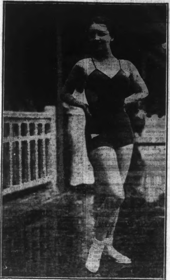
Le maillot de bain à la mode.

Il y a des femmes qui jeunes, folles, bien faites ne savent pas et ne sauront jamais s'habiller. Au lieu de mettre en valeur, par des atours appropriés, leur type qui exige certaines coupes et certains coloris, elles choisissent tout le contraire de ce qui leur faut.