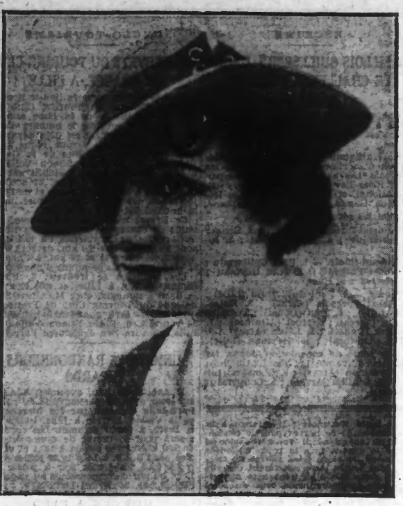
Chapeau de paille grise, crin noir laqué.

On porte, en cette saison, beaucoup de capelines. Elles font un si joli cadre aux visages féminins ! On les garnit de boutons d'or, de coquelicots, de marguerites et d'autres charmantes fleurs des champs.