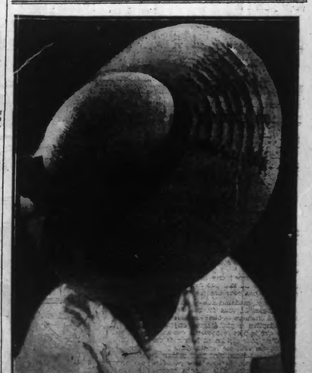
Capeline en paille d'Italie, ruban velours noir, guirlande fleurs.