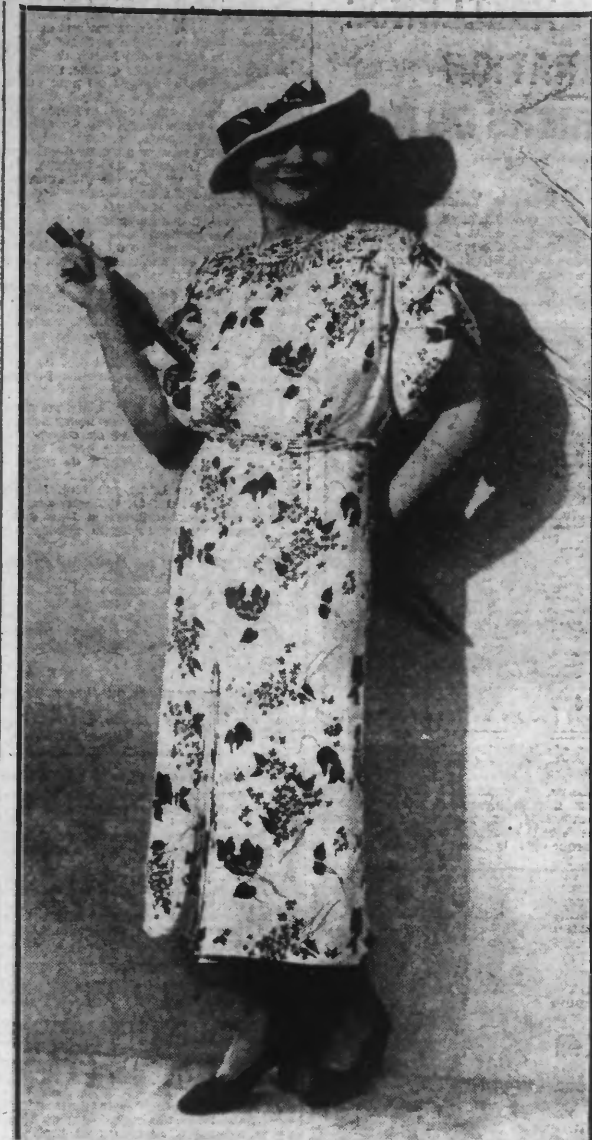
Robe fleurie fond blanc, impression coques licots. Chapeau blanc, ceinture cirée noir.

Si la partie à réajuster était un peu grosse, il faudrait la maintenir plusieurs minutes au moins.