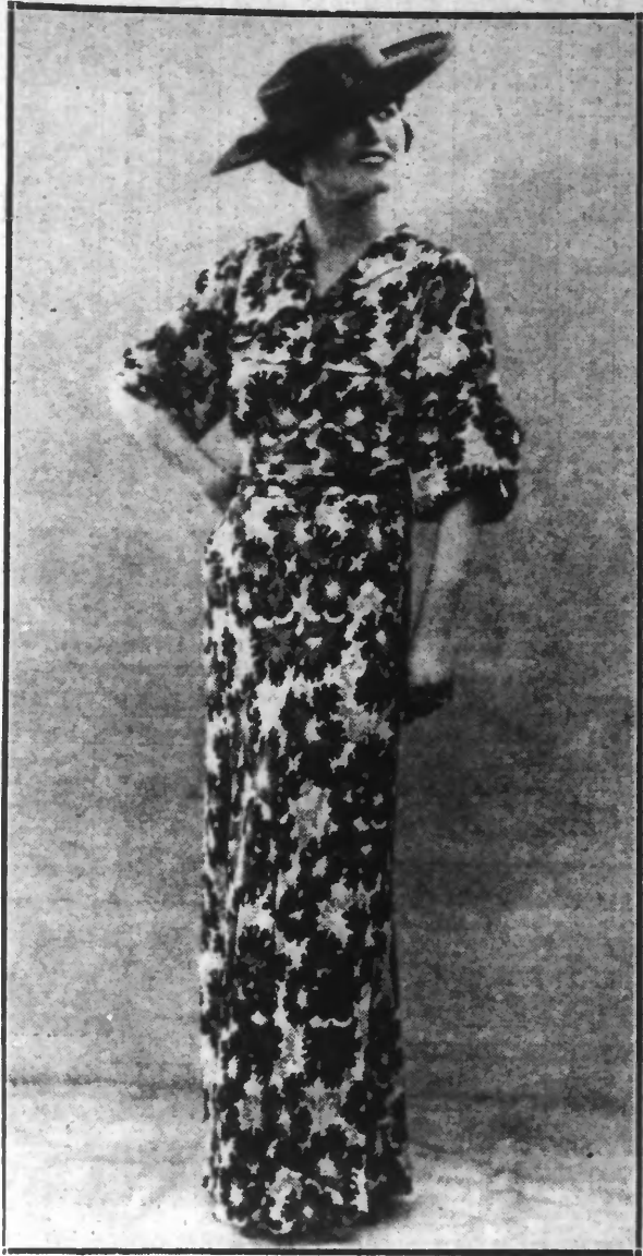
Robe fleurie noir et blanc, canotier noir.