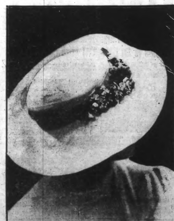
Capeline en paille d'Italie, ruban velours noir, guirlande fleurs.

Grée : B. SIMON, 20, rue La Boétie, PARIS (8 e ) 9217