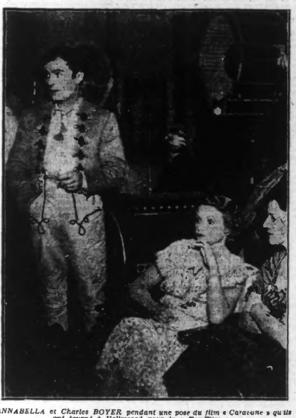
ANNABELLA et Charles BOYER pendant une pose du film 'Caravane' à qui ils ont tourné à Hollywood pour la Fox-Film

J'aborde l'Amérique non pour la découvrir mais pour y travailler. Mon premier contact avec elle est celui que je pense tout Européen nouvellement débarqué. Le dynamisme de la vie américaine vous heurte dès le premier instant, vous bouscule dans vos vieilles habitudes.