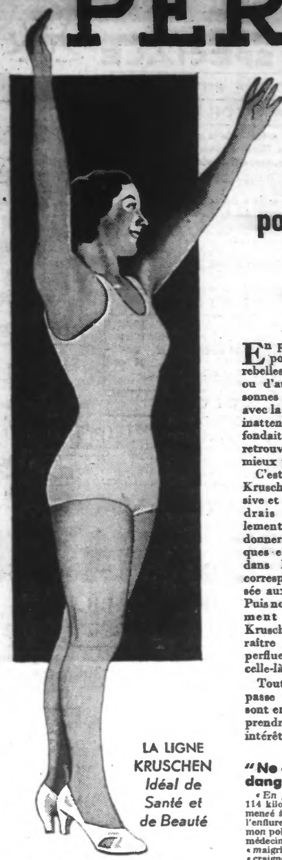
LA LIGNE KRUSCHEN Idéal de Santé et de Beauté