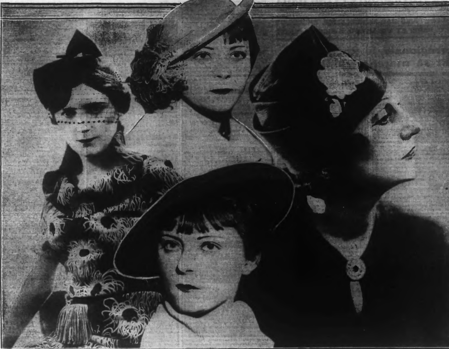
En haut, de gauche à droite : Toque noire avec épingle de bois doré ; chapeau crêpe beige garni de plumes d'autruche beige et marron ; toqué drapé, paille d'Italie. En bas, au milieu : Grand chapeau de taffetas violet clair.

Le costume est un jeu. Les compagnies de chemins de fer ont mis les sports d'hiver à la portée des bourses les plus moyennes et chacune veut et peut maintenant aller, pendant quelques jours, s'ébrouer dans la neige éblouissante des montagnes.