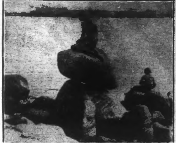
Une vue du port de COPENHAGUE, les révoles Nordiques qui coulent bore à leur suit.

Il y a, dans la péninsule scandinave, que dans le seul Danemark qu'on puisse boire quand on veut, ce que l'on veut. La devise libérale a reconquis ce pays en y attirant nombre de pélerins altérés venus des contrées voisines. De Malmo, par exemple, un des ports les plus importants de la Suède c'est par milliers que, chaque samedi les sujets du roi Gustav s'embarquent à destination de Copenhague. Je fus quel que temps avant de comprendre l'extraordinaire engouement dont sem-