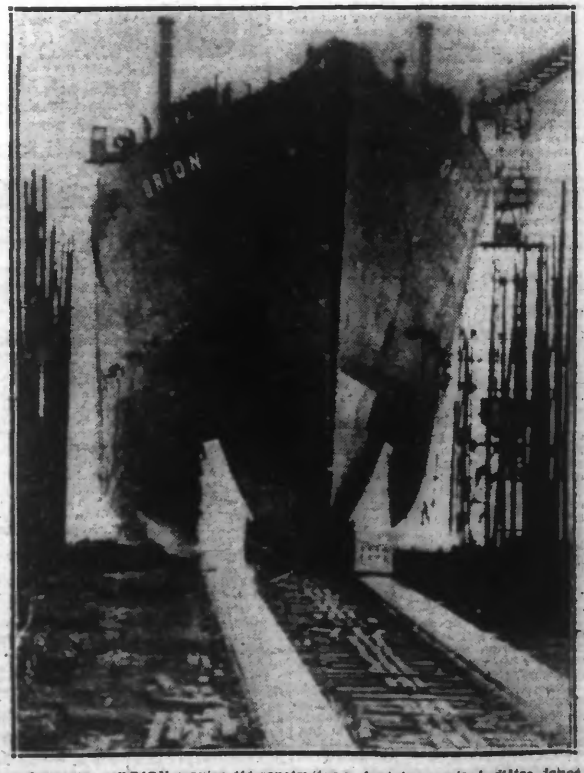
Le navire « ORION » qui a été construit en Angleterre, vient d'être lancé par T. S. F. par le Duc de Gloucester, troisième fils du Roi d'Angleterre actuellement en Australie.