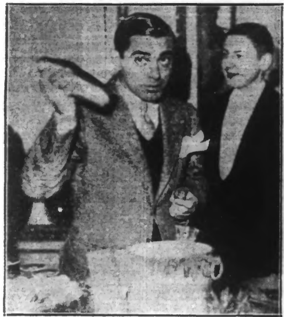
Voici EDDIE CANTOR, arrivé à Paris, offrant à ses amis son « cocktail » favori qu'il confectionne lui-même.