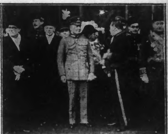
Les membres du Corps diplomatique ont, comme de coutume, présenté leurs vœux pour la nouvelle année au Président de la République. Voici un groupe de diplomates sortant de l'Élysée : en haut, au centre, l'attaché militaire allemand et, à droite, S E FAKHRY PACHA, Ministre d'Égypte.