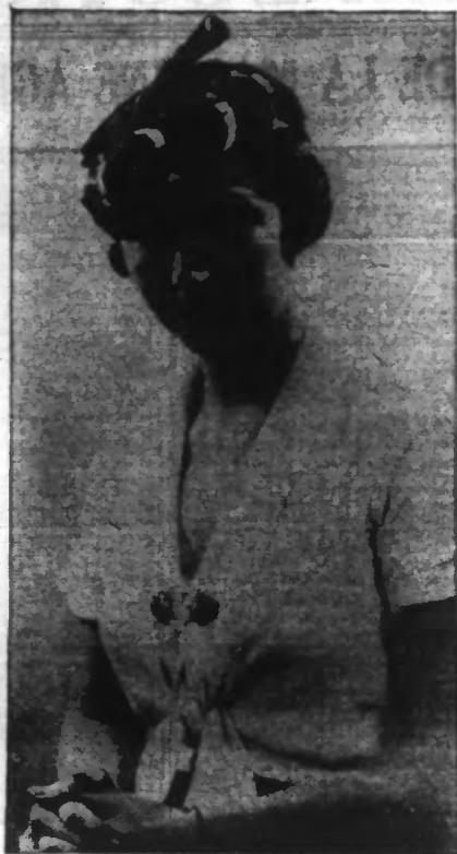
Toque plumes collées.