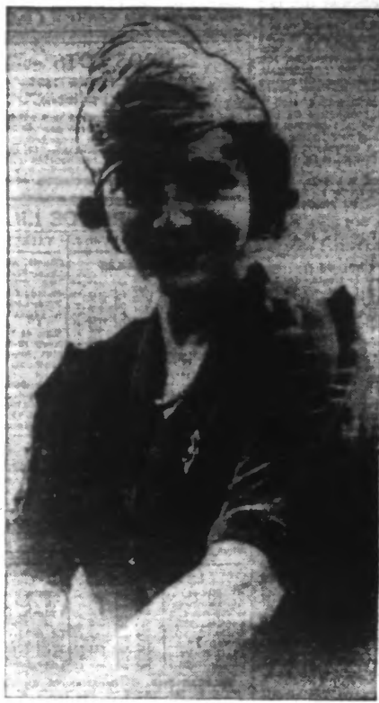
Toque plumes grises.