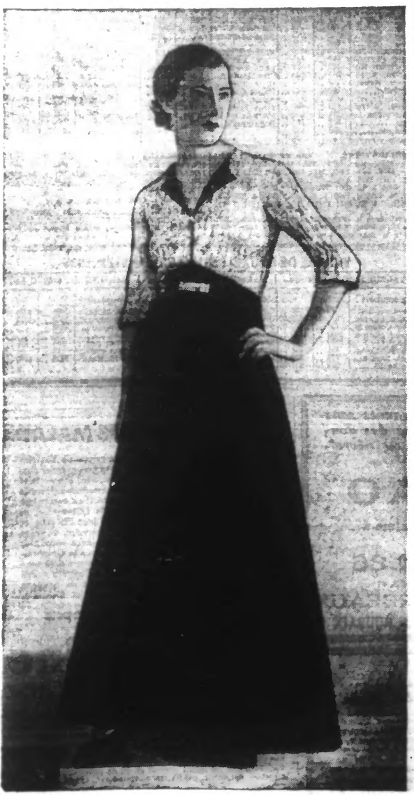
Robe de velours uni, corsage brodé.

La mode propose, la silhouette dispose. Pour maigrir sans nuire à la santé, le THE MEXICAIN du Dr JAWAS s'impose. 9107