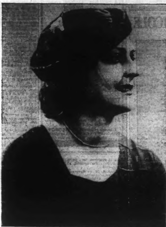
Boléro en satin noir plume fantaisie.