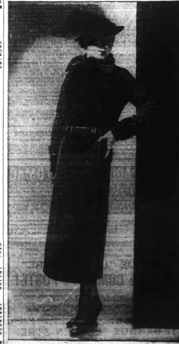
Manteau en lainage noir garni d'astrakan noir.

Les lectrices qui désirent les patrons-primes des modèles ci-dessus, n'auront qu'à nous adresser leur commande accompagnée du montant en timbre-poste. Le prix de chaque patron est de deux francs. Les envois sont faits franco à domicile. Bien indiquer le numéro du ou des patrons demandés et l'adresse du destinataire. Envoyez votre demande à : Service des Patrons du « Réveil du Nord », 100, rue de Paris, Lille.