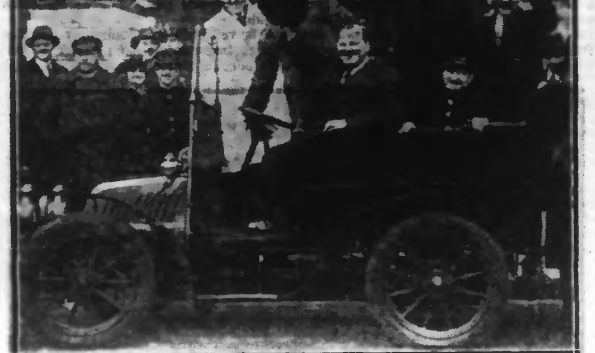
Les employés d'un garage de Vincennes venus hier matin, au Pavillon de Flore...

tomatement vers l'antichambre réservée. Cet inconnu d'ailleurs fait preuve d'un mutisme parfait.