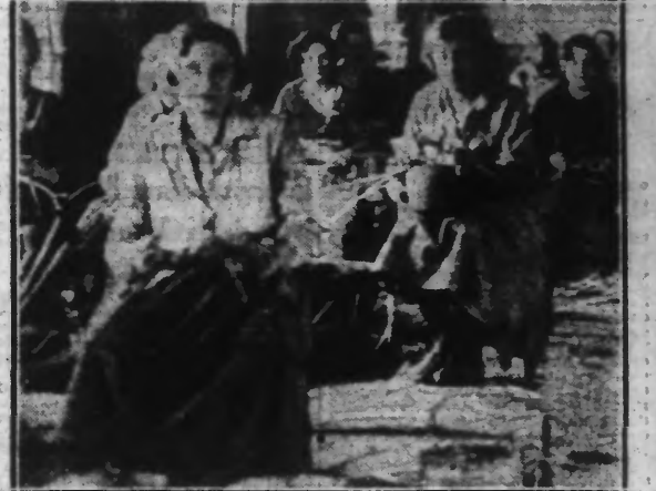
Des jeunes filles occupées à tresser des paniers dans un atelier de GRAND-FORT-PHILIPPE.

De temps immémorial, les petits artisans vanneriers travaillant à domicile furent seuls à produire exclusivement de la vannerie. Les autres firmes ont abouti à leur exploitation la confection de jouets, meubles et objets divers.