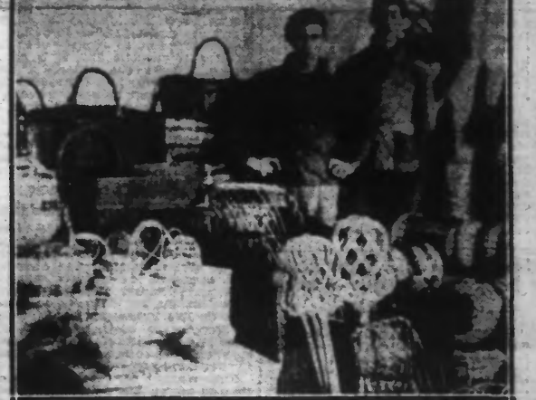
Paniers aux formes multiples, bal-meubles, fauteuils, articles de pêche, etc., sont ébroués et expédiés aux quatre coins de notre région.

Les conséquences d'une grève A la suite des grèves d'Anvers, la maison A. VAN OYE et Cie a décidé en 1901 de créer de nouveaux ateliers à