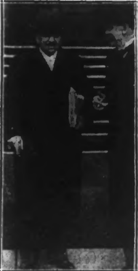
M. LAVAL, Ministre des Affaires Étrangères, sortant du Conseil des Ministres en compagnie de M. ROY, Ministre des Travaux Publics.

Les ministres se sont réunis en Conseil hier matin, à 10 heures, à l'Élysée, sous la présidence de M. Albert Lebrun.