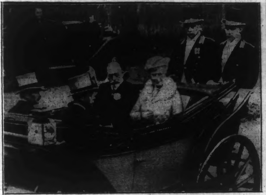
Dans quelques jours, le Roi et la Reine d'Angleterre célébreront le 25 e anniversaire de leur règne. De grandes fêtes sont prévues à cette occasion. NOTRE CLICHÉ MONTRE UNE RÉCENTE PHOTOGRAPHIE DE LA FAMILLE ROYALE ANGLAISE.