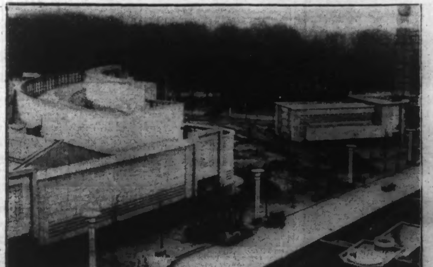
Voici une vue générale des Pavillons de la France et de la Ville de Paris à l'Exposition Universelle et Internationale de BRUXELLES.