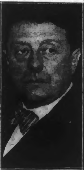
M. Marcel PEYROUTON, Résident général de Tunisie, qui vient d'être nommé Gouverneur Général des Colonies.

Sur la proposition de M. Louis Rollin, ministre des Colonies, M. Peyrouton a été nommé gouverneur général des