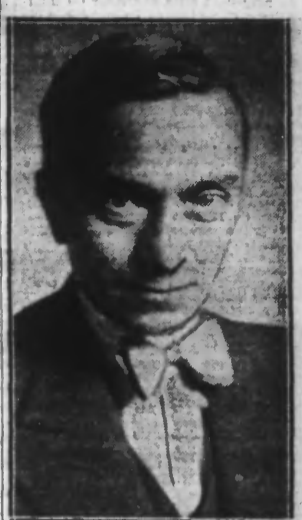
Voici le Capitaine CLAYEUX, chargé de la préparation de l'équipe française aux Jeux Olympiques de 1936.