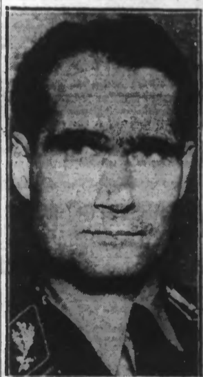
Voici M. Rudolf HESSE, le Chef des S. A., dont l'Allemagne fête le 41 e Anniversaire.

d'une toilette gris perle et coiffée d'un chapeau assorti.