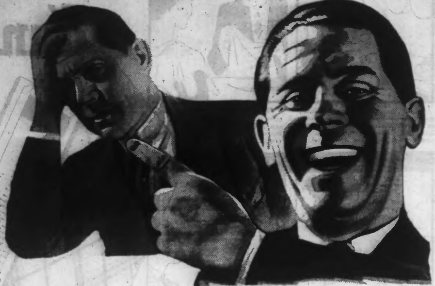
75 % de nos maux et indispositions ont la Constipation pour origine

Plus de troubles digestifs, plus de migraines, plus de nervosité, de lassitude, de mauvaise humeur — mais un bien-être merveilleux.