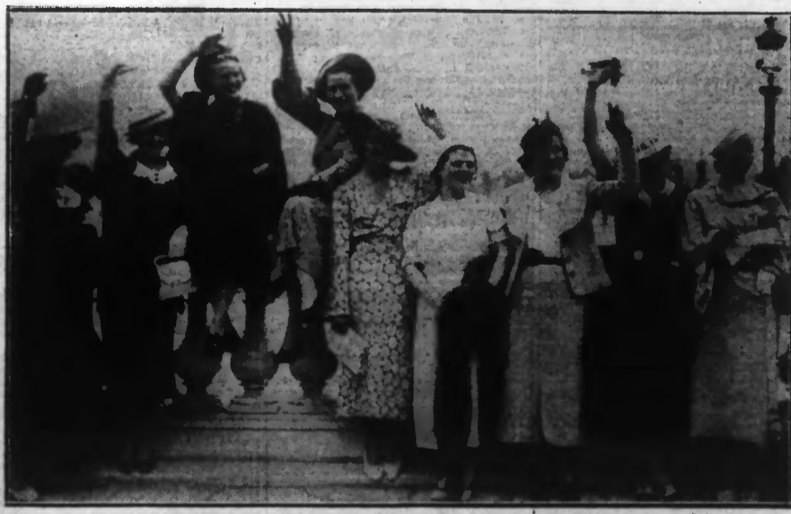
Un joli groupe des Reines de Beauté. On voit, de gauche à droite : Miss HONGRIE, Miss DANUBE, Miss ITALIE, Miss RUSSIE, Miss ESPAGNE, Miss TCHÉCOSLOVAQUIE, Miss HOLLANDE, Miss BELGIQUE et Miss DANEMARK.

L'enceinte de la vieille haute ville de Boulogne connue hier après-midi une animation inaccoutumée. En effet, avait lieu la réception des Reines de Beauté d'Europe par la municipalité boulognoise.