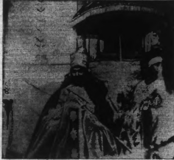
L'Empereur était assis sur le trône dans une attitude hiératique...

Addis-Abeba, Novembre 1935. Du haut de l'escalier de pierre du vieux palais impérial, le regard s'étend au loin, par delà les toits des maisons de la ville, cachées au milieu des frondaisons d'eucalyptus, jusqu'aux montagnes sombres et escarpées qui ferment l'horizon de leur ceinture imposante.