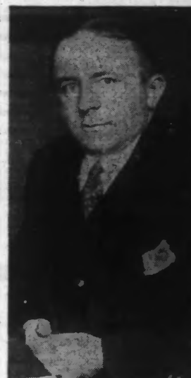
M. Roger SALENGRO Député-Maire de LILLE qui a présidé hier la déléation des Gauches.

En fin de journée, chacun restait sur ses positions dont le moins qu'on puisse