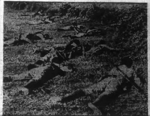
INFANTERIE ETHIOPIENNE, POURSUIVANT SON OFFENSIVE. (Photo transportée par avion).

DES MESURES DE PRÉCAUTION SONT PRISES EN ITALIE OU 100.000 SOLDATS DEVANT PARTIR EN CONGÉ SONT MAINTENUS SOUS LES DRAPEAUX