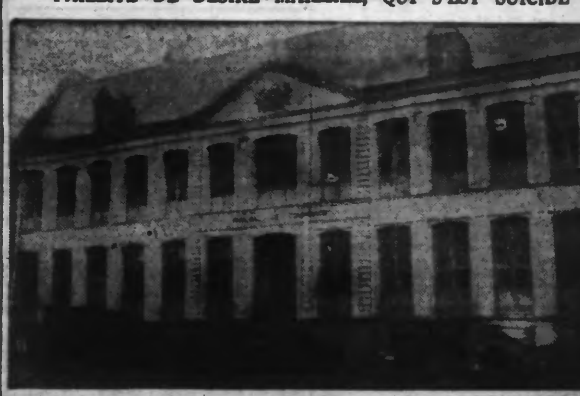
Le Tribunal de Commerce de VALENCIENNES où l'on a évoqué les premiers effets du krach retentissant.