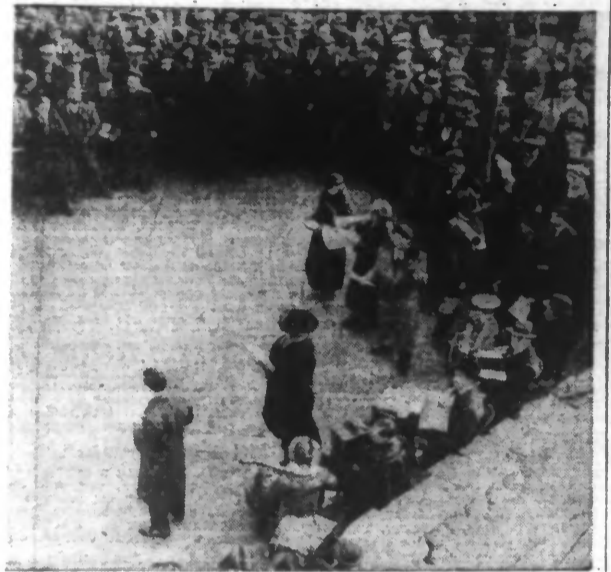
Le cercle se resserra tout doucement autour de l'accordeoniste...

Le musicien a une charmante pointe d'accent du Midi qui unit, quand il parle, le soleil de Marseille aux lueurs plus subtiles du soleil parisien.