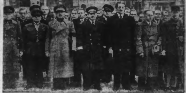
Les personnalités qui ont inauguré le Salon ; on voit au centre, le Colonel d'Aviation...