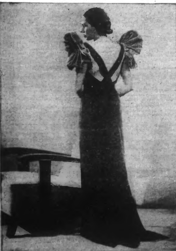
Soie noire, mancherons velours corail décollés des bretelles. (Photo Henri Manuel).