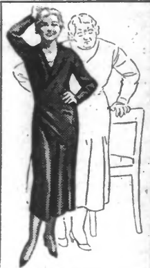
"Je pesais 87 kilos, je n'en pesais plus que 69. Je ne me suis jamais trouvée en aussi bonne santé."

Une cure de santé en même temps qu'une cure amaigrissante, et celle-ci parce que celle-là, voilà donc l'avis unanime de ceux qui ont fait l'expérience Kruschen pour maigrir. Et c'est impressionnant parce que c'est vrai, parce que c'est une évidence qui ressort de faits précis, de preuves authentiques, de mille cas réels. J'ai encore recueilli de nombreux exemples typiques de l'efficacité, de l'utilité quotidienne de la célèbre "petite dose". D'ailleurs, je me réserve d'y revenir dans un prochain article. Mais les habitudes de Kruschen parlent et trionnent. J'ai sous les yeux de nombreuses lettres spontanées, et remplies de renseignements précieux. On me permettra, en guise de conclusion, d'en reproduire ici quelques-unes.