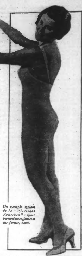
Un exemple typique de la "Plastique Kruschen" : lignes harmonieuses, jeunesse des formes, santé.

Grand-Papa Kruschen au micro ! Chaque soir entre 20 et 22 heures, le si populaire