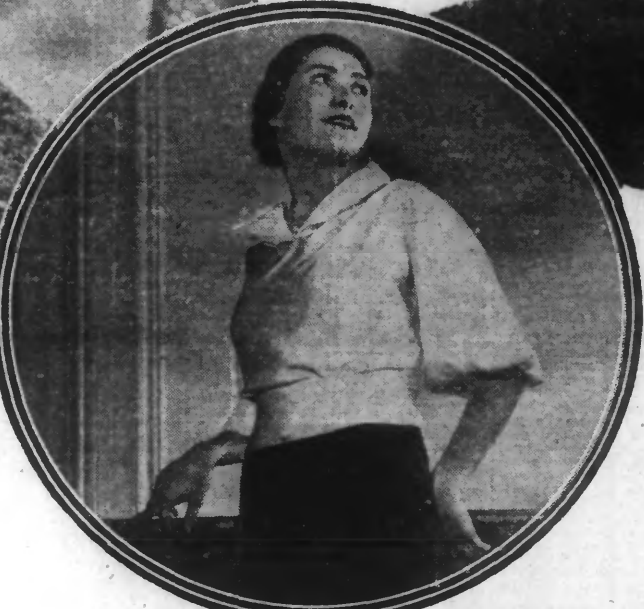
En haut : De gauche à droite : ROBE DU SOIR en velours He de vin ; CLOCHE en paille bleu marine garnie ruban gros grain orné de clous ; BERET fantaisie en feutre drapé devant, garni alvéoles ; BLOUSE en crêpe rose, encolure garnie petits plis. — En bas : BLOUSE en crêpe de Chine.