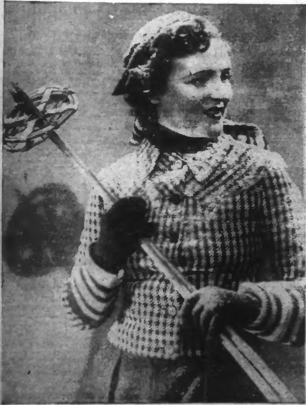
Êtes à partir pour la montagne

LISEZ les beaux romans de la famille 2,90 de la Bibliothèque AZUR. - Fr. 2,90