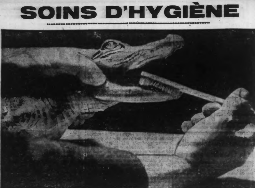
PETER, jeune alligator du Zoo de Londres, possède une dentition délicate qui nécessite un entretien quotidien. Notre photo montre la toilette de PETER qui ne semble pas particulièrement enchanté de ces soins d'hygiène.

CONCOURS GÉNÉRAL AGRICOLE ET 15 e SALON DE LA MACHINE AGRICOLE. Ils se tiendront simultanément cette année du mardi 17 au dimanche 22 mars au Parc des Expositions de la Ville de Paris.