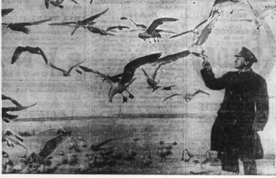
Sur la plage anglaise de BLACKPOOL-BEACH, ce portier d'hôtel apporte chaque matin un excellent déjeuner aux mouettes qui le connaissent bien.